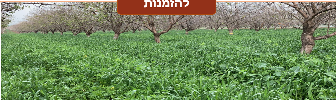
גידולי שירות - צמחים שעובדים עבורך!